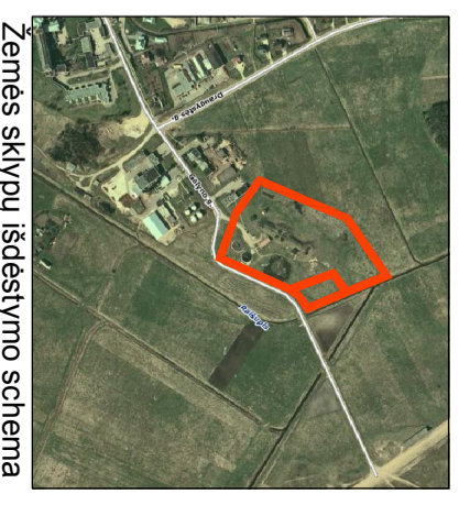
Žemės sklypų išdėstymo schema